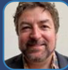
Y Cyngorydd Clive Davies Aelod Cabinet i'r Economi ac Adfywio Cyngor Sir Ceredigion