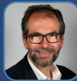
Cyd-Cadeirydd Y Cyngorydd James Gibson-Watt Arweinydd Cyngor Sir Powys