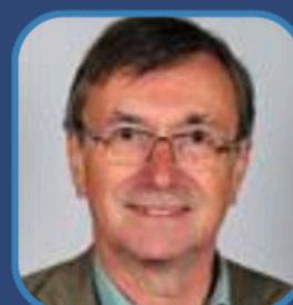
Y Cyngorydd David Selby Aelod Cabinet ar gyfer Bowys Fwy Llewyrchus Cyngor Sir Powys